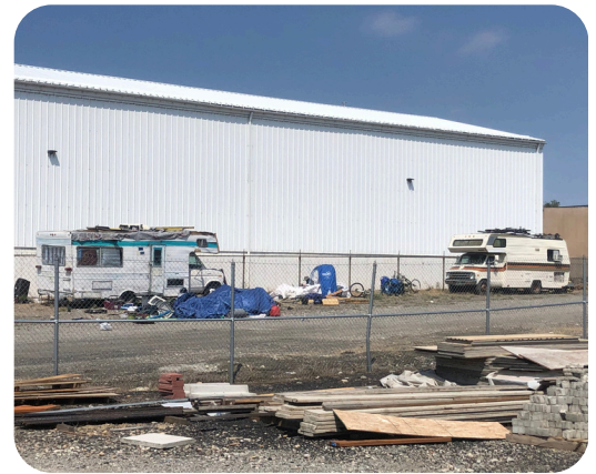
Результаты в нашем районе во время оккупации Jewels Helping Hands в 2021 году.