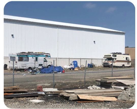
Kết quả tại khu vực của chúng tôi trong thời gian Jewels Helping Hands hoạt động năm 2021